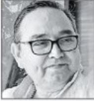
नरेन्द्र भदौरिया राष्ट्रवादी विचारक एवं लेखक