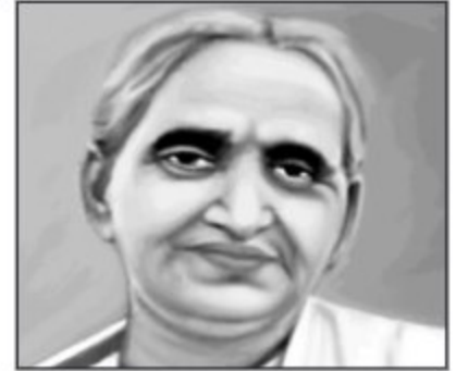
संस्थापिका व आद्य संचालिका श्रीमती लक्ष्मीबाई केलकर

राष्ट्र सेविका समिति की संस्थापिका और आद्य संचालिका श्रीमती लक्ष्मीबाई केलकर ने महिलाओं में छिपी शक्तियों को उस समय पहचाना जब नारी सशक्तिकरण की बात से कोई परिचित भी नहीं था। 25 अक्टूबर 1936 विजयदशमी के दिन महिलाओं के एक ऐसे संगठन की नींव रखी गई जो व्यक्ति निर्माण के साथ समाज और राष्ट्र के निर्माण में भी योगदान दे।