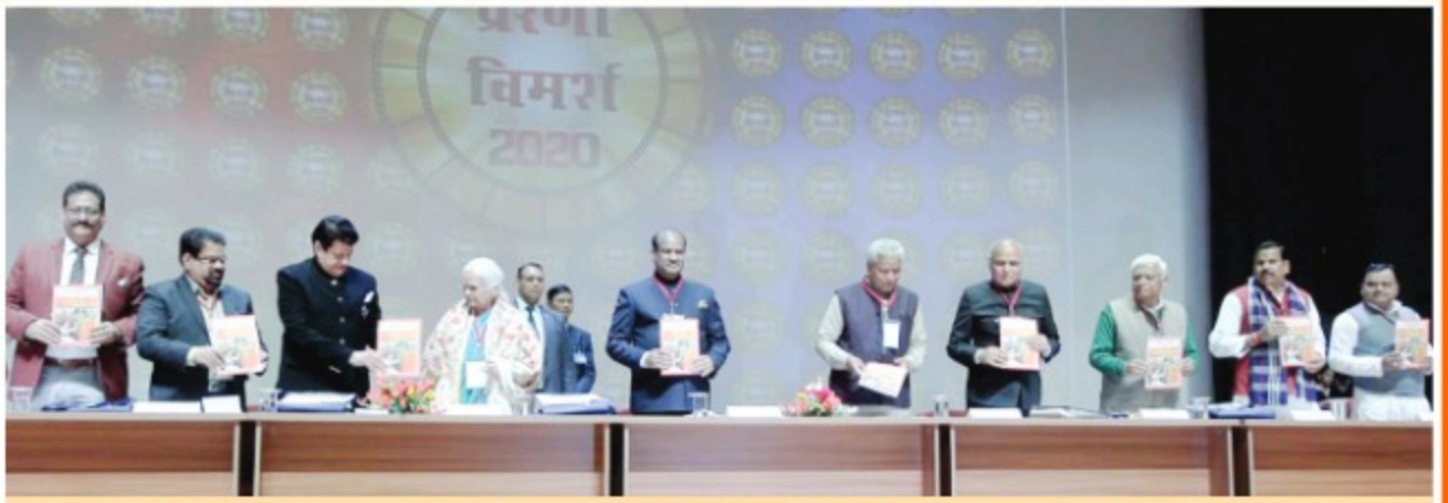
प्रेरणा विमर्श 2020 के अवसर पर केशव संवाद पत्रिका के विशेषांक सिने विमर्श और भारतीय विरासत का विमोचन करते लोक सभा अध्यक्ष श्री ओम बिडला जी, गोवा की पूर्व राज्यपाल श्रीमती मृदुला सिन्हा जी, उत्तर प्रदेश के जल शक्ति मंत्री डॉ. महेन्द्र सिंह जी व अन्य अतिथिगण