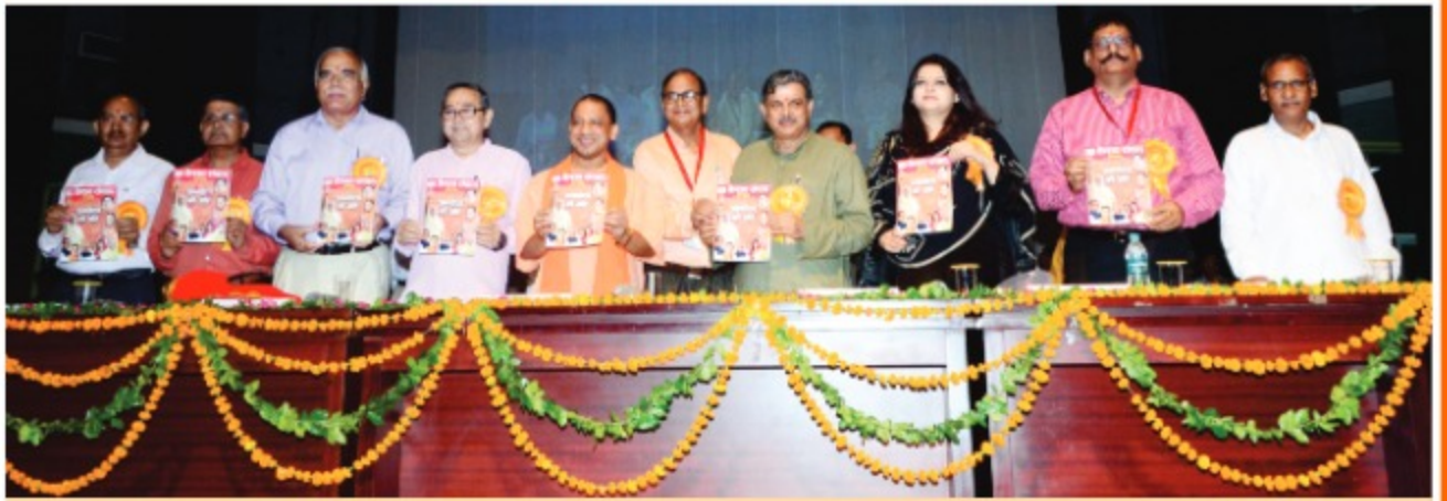
केशव संवाद पत्रिका के विशेषांक अन्योदय की ओर का विमोचन करते सह सरकार्यवाह श्री दत्तात्रेय होसबले जी, उत्तर प्रदेश के मुख्यमंत्री श्री योगी आदित्यनाथ जी, वरिष्ठ लेखिका अद्वैता काला जी व अन्य अतिथिगण