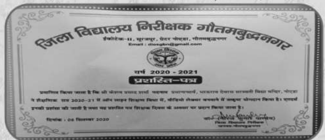
ऑनलाइन शिक्षण में उत्कृष्ट योगदान के लिए विद्यालय को सम्मान