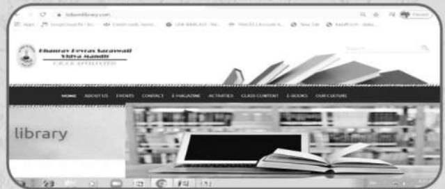
कोरोना काल में ऑनलाइन पुस्तकालय