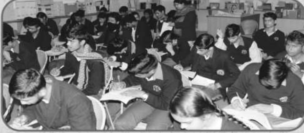
पंचपदी शिक्षा प्रणाली