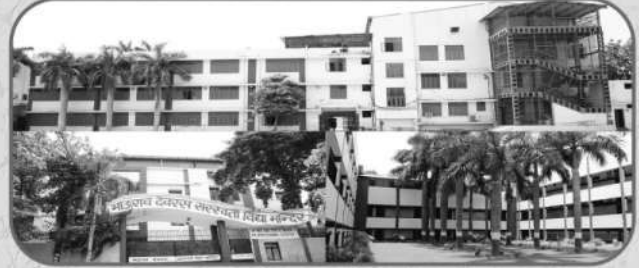
विशाल विद्यालय भवन