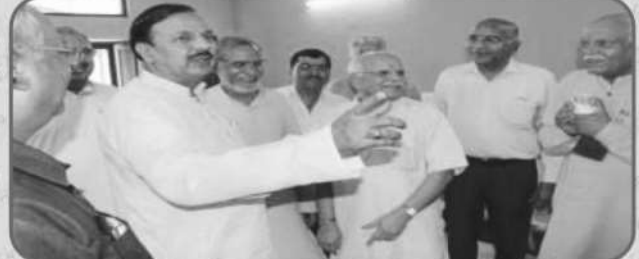
शिक्षाविदों व समाजसेवियों का प्रतिनिधित्व