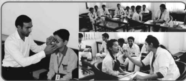
समुचित चिकित्सा व्यवस्था