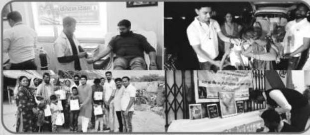
पूर्व छात्र परिषद् क्रियाकलाप