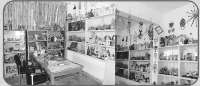
सतत् मूल्यांकन पद्धति