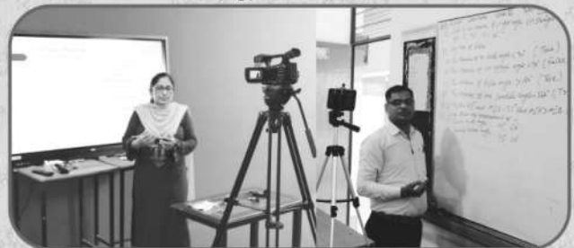
कोरोना काल में ऑनलाइन कक्षायें