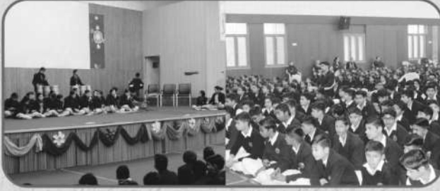
विशाल संस्कृति भवन