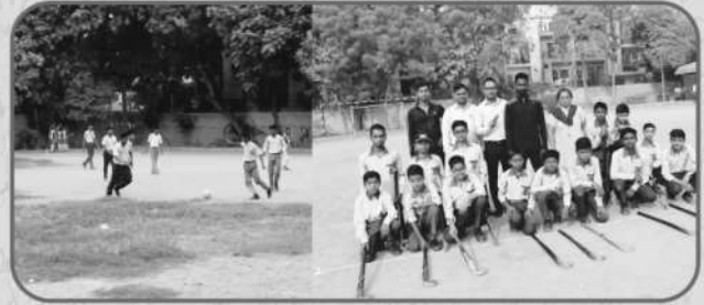
विशाल क्रीड़ा स्थल