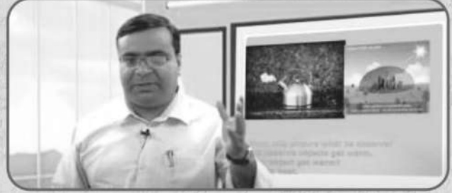
स्मार्ट क्लास का प्रयोग