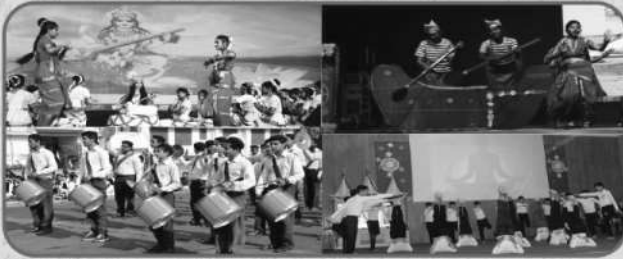
सांस्कृतिक व शारीरिक गतिविधियां